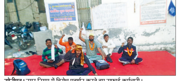
सोनीपत। नगर निगम में विरोध प्रदर्शन करते हुए सफाई कर्मचारी।