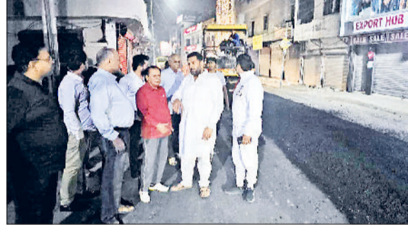
सोनीपत। सड़क निर्माण कार्य का निरीक्षण करते हुए विधायक निखिल मदान।

बुधवार देर रात विधायक निखिल मदान ने पीडब्ल्यूडी विभाग द्वारा 1 करोड़ 63 लाख रुपये की लागत से बनाये जा रहे ओल्ड डीसी रोड के निर्माण कार्य का औचक निरीक्षण किया और मौके पर मौजूद पीडब्ल्यूडी विभाग के अधिकारियों को आवश्यक दिशा निर्देश दिए और कार्य की गुणवत्ता की जांच की। विधायक निखिल मदान ने कहा कि ओल्ड डीसी रोड का निर्माण कार्य शुरू हो चुका है। इस सड़क को 1 करोड़ 63 लाख रु की लागत से