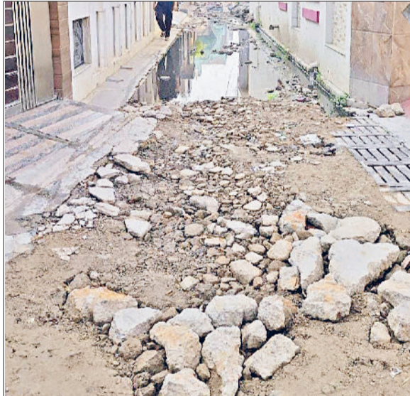
गन्नौर। गांधी नगर में मलबे व दूषित पानी से अटी पड़ी निर्माणधीन गली।

मलबे व दूषित पानी से अटी पड़ी निर्माणधीन गली