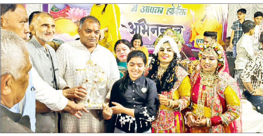
गोहाणा। कार्यक्रम के दौरान अतिथियों का स्वागत करते हुए।

से बड़ी संख्या में गणमान्य व्यक्ति, महिलाएँ, बच्चे और युवा वर्ग उपस्थित रहे। उत्सव में सहभागी जन विषयों पर लाभान्वित हो रहे हैं और अपनी जिज्ञासाओं का समाधान भी प्राप्त कर रहे हैं।