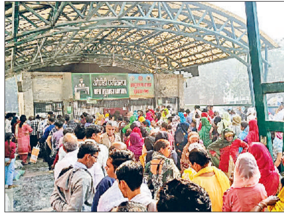
सोनीपत। रजिस्ट्रेशन काउंटर के बाहर लगी मरीजों की भीड़ व बंद पड़ी चर्म रोग ओपीडी।