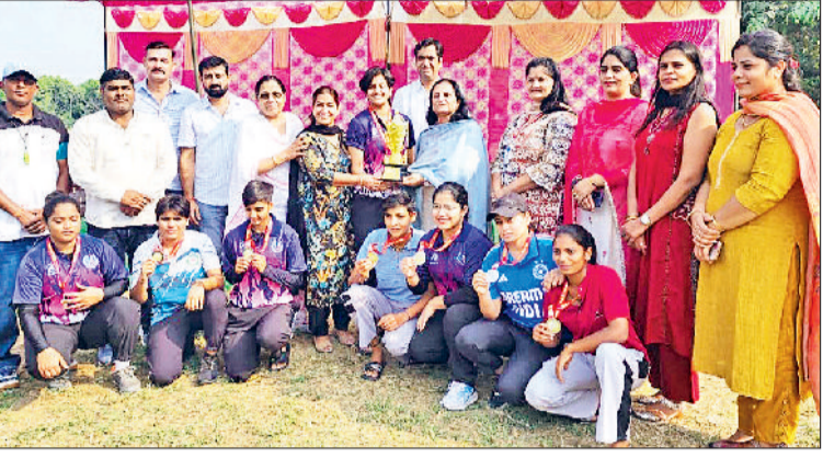
सोनीपत। उपविजेता रहे विद्यार्थियों को सम्मानित करते हुए आयोजक।