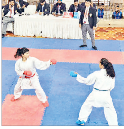
कराटे स्पर्धा में एक दूसरे का मुकाबला करते खिलाड़ी।